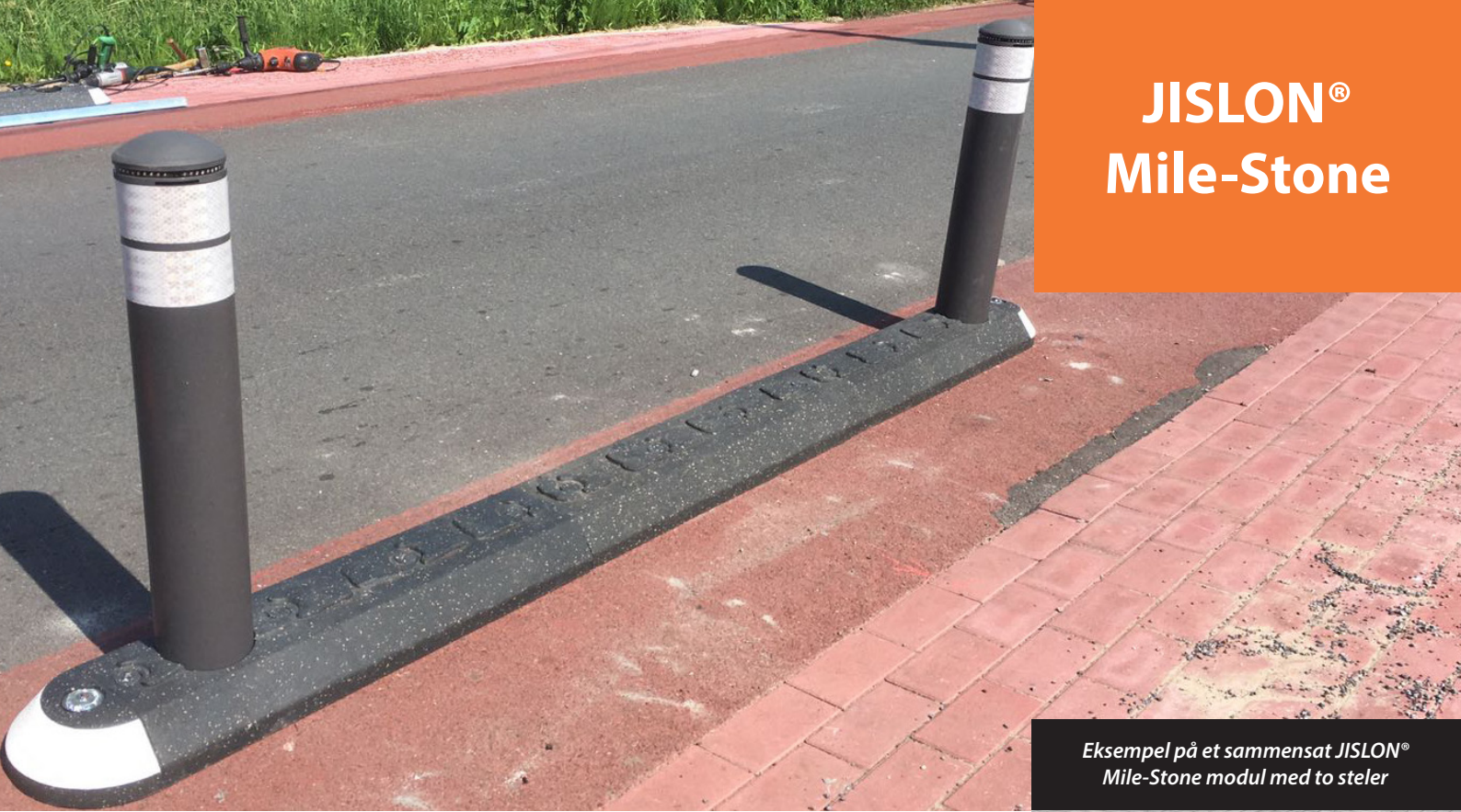
Eksempel på et sammensat JISLON® Mile-Stone modul med to steler