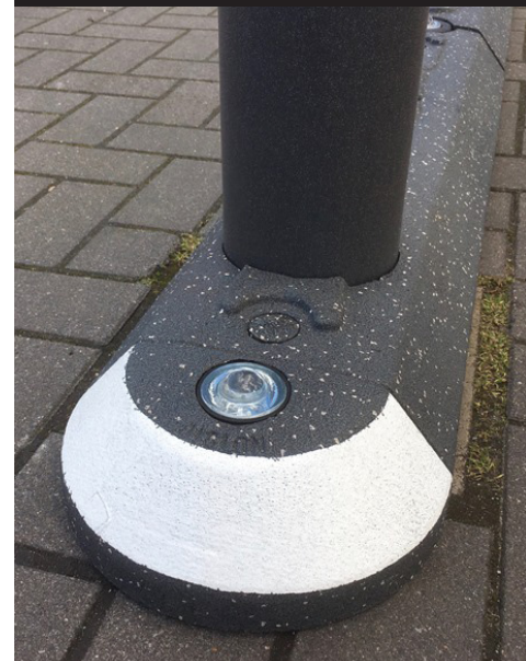
Det hvide endestykke og glasrefleksen gør ligeledes JISLON® Mile-Stone iøjnefaldende