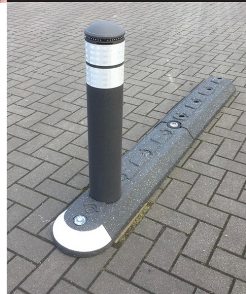
Stelens refleksbånd gør JISLON® Mile-Stone synlig i trafikken

JISLON® Mile-Stone har som standard fordybninger på Ø80 mm, og gummimodulet har desuden en ekstra fordybning foran. Ved hjælp af et kopbor er det nemt at lave huller til både Ø80 mm og Ø130 mm steler. Stelerne findes i flere forskellige typer og farver samt i tre hårdheder, så de er påkørselsvenlige og dermed rejser sig op igen efter evt. påkørsel.