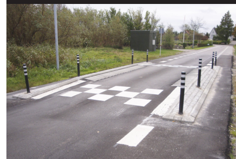
Sort - 800 mm høj Hasseløvej, Væggerløse