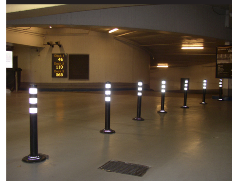
Sort - 800 mm høj P-kælder Israels Plads, Kbh.