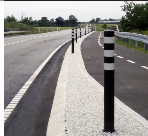
Sort - 800 mm høj Broen over Givevej, Ejstrupholm, Brande

Jislon® stelen kan også monteres i bløde underlag.