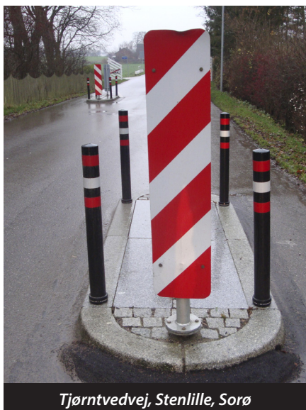
Tjørntvedvej, Stenlille, Sorø