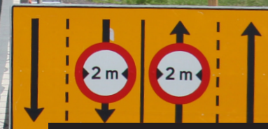
Udbygning af motorvej, Skærup mellem Vejle og Fredericia