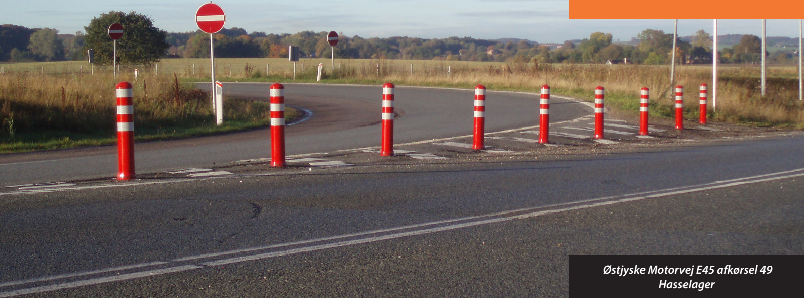
Østjyske Motorvej E45 afkørsel 49 Hasselager