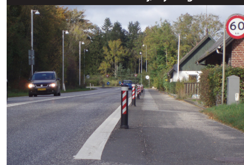
Sort - Kantmarkering Hjøllund, Hampen