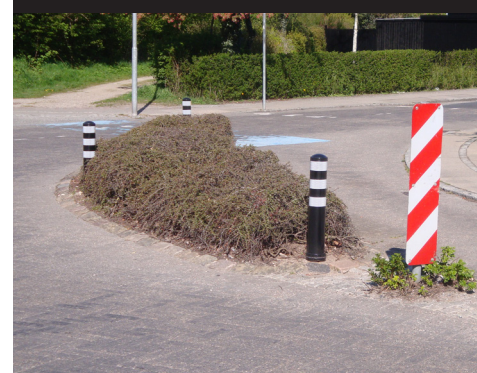
Sort JislON Ø130 Christianslundsvej, Nyborg