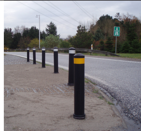
Sort JislON Ø130 Motorvejstilkørsel, Horsens

JislON® stelen kan også monteres i bløde underlag.