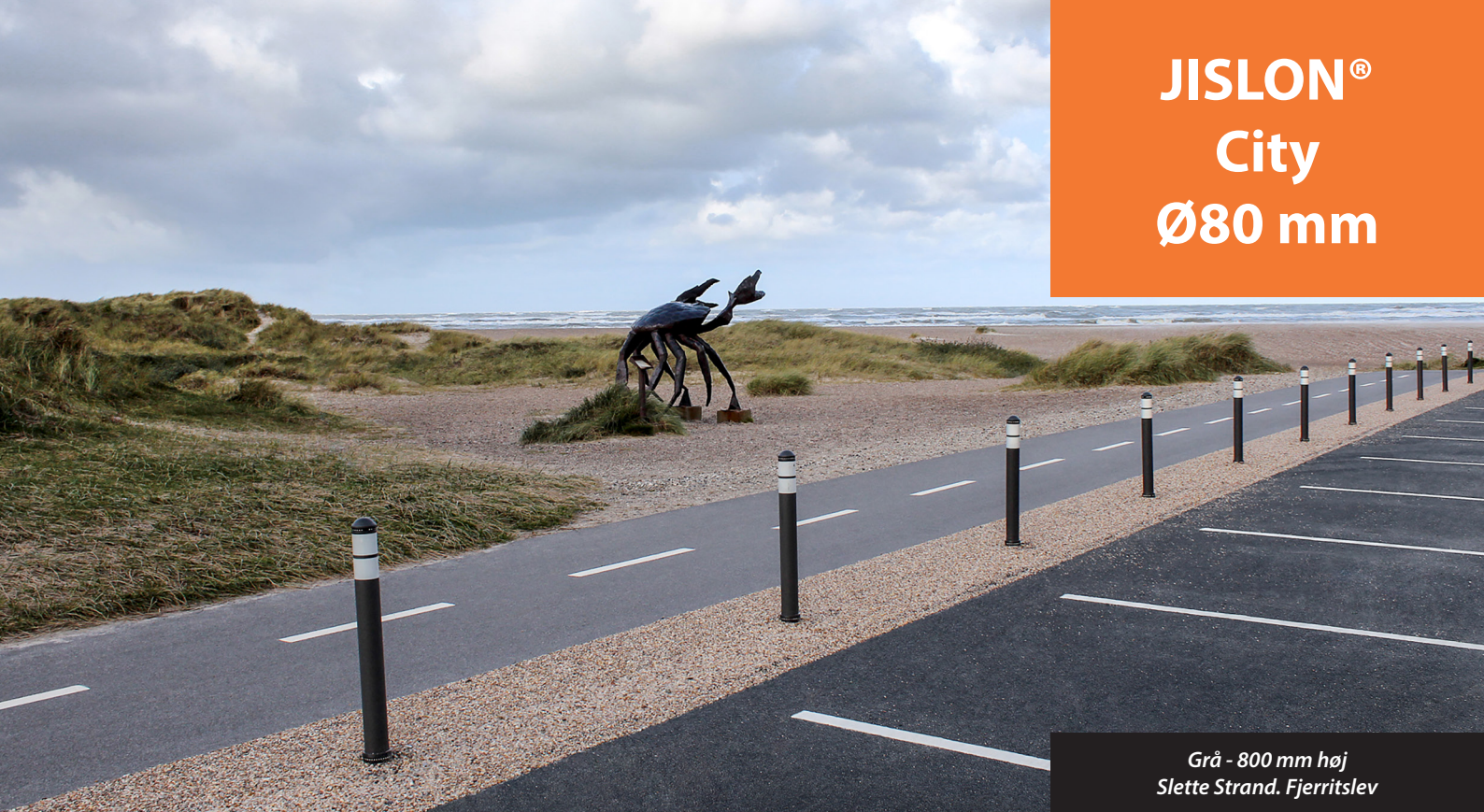
Grå - 800 mm høj Slette Strand, Fjerritslev