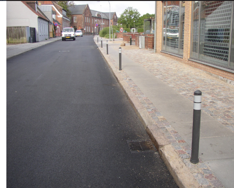
Grå - 800 mm høj Læderstrædet, Roskilde

Ideel på veje og stier, hvor udrykningsvogne skal hurtigt igennem.