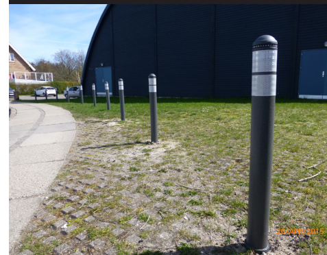
Grå - 800 mm høj Engade 19, Kerteminde