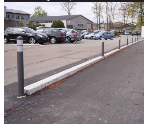
Grå - 800 mm høj Skodsborgvej, Nærum